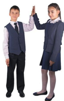
Пиджак для девочки мод. N17 арт. D105