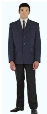
Пиджак для старшеклассника арт. M101 Брюки для старшеклассника арт. M101

14 Коллекция "Синий меланж и синий габардин"