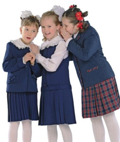
Жилет "Бантик" арт. D112 Юбка плиссе арт. D405