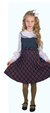
Сарафан "Арина" арт. D101