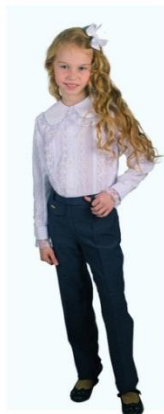
Брюки "Классика" арт. D111