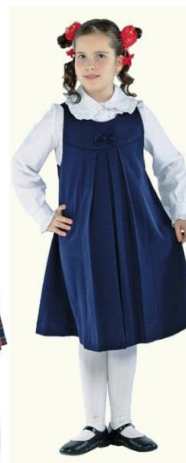
Сарафан "Маша" арт. D119