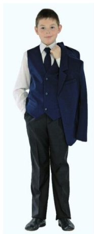
Жилет для мальчика арт. M102 Брюки для мальчика арт. M101