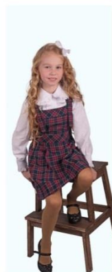
Сарафан "Даша" арт. D110