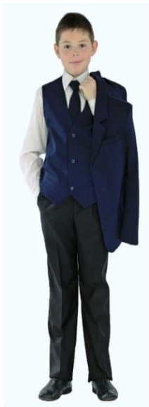
Жилет для мальчика арт. М202 Брюки для мальчика арт. М301