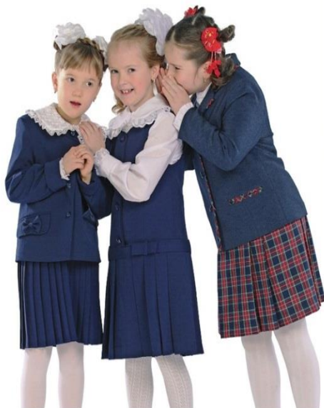
Жакет "Бантик" арт. Д012 Юбка плиссе арт. Д405