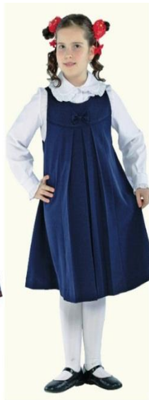
Сарафан "Маша" арт. Д019

ГОСУДАРСТВЕННОЕ БЮДЖЕТНОЕ ОБЩЕОБРАЗОВАТЕЛЬНОЕ УЧРЕЖДЕНИЕ